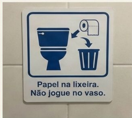
Brasil: Papel a la papelera