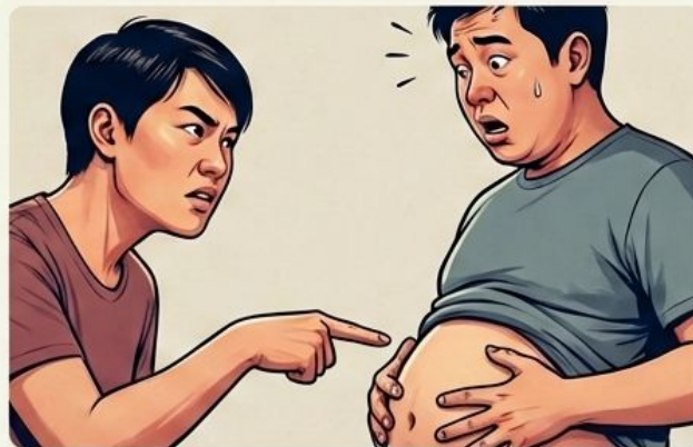
Tailandia (Honestidad Brutal)