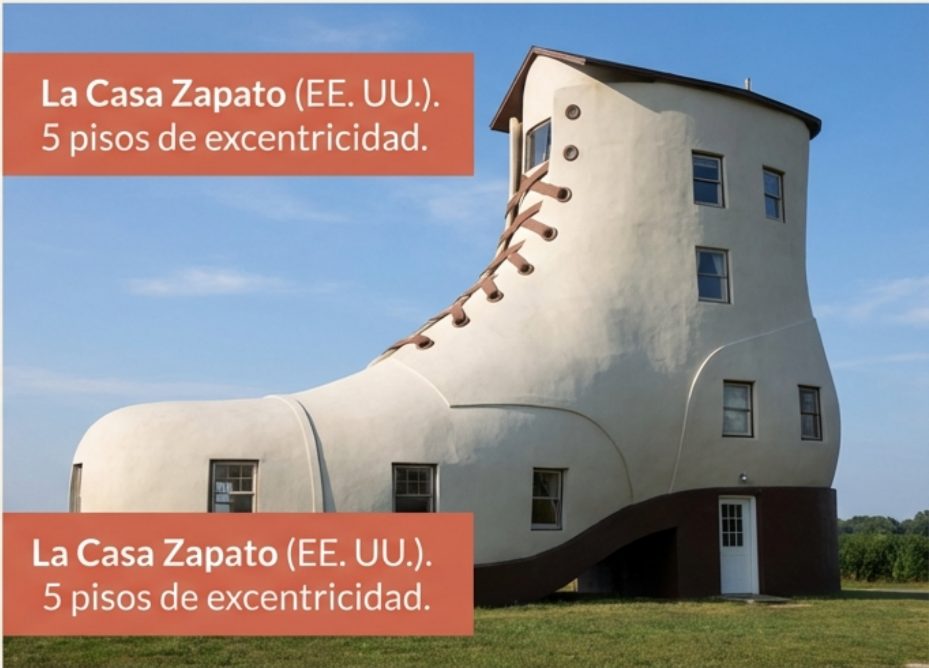
La Casa Zapato (EE. UU.). 5 pisos de excentricidad.