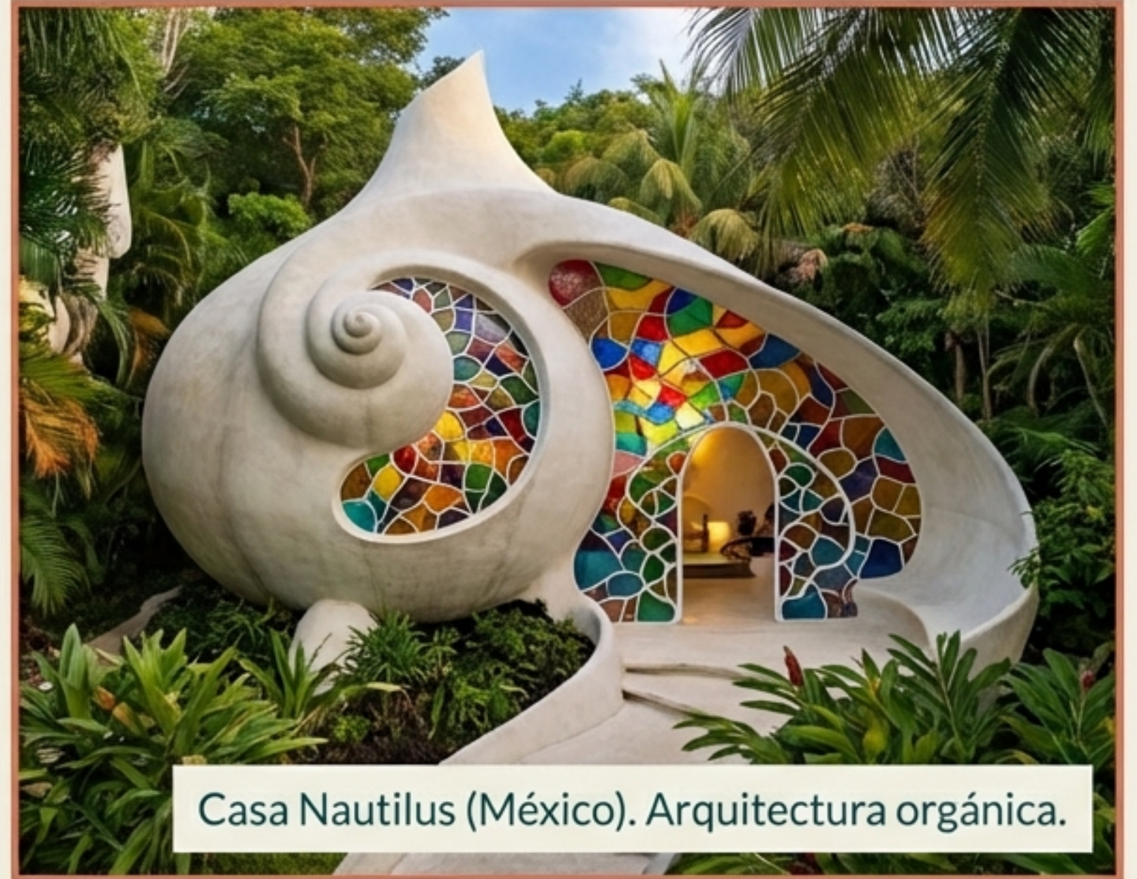
Casa Nautilus (México). Arquitectura orgánica.

Si vivieras aquí, ¿te sentirías como un humano o como un personaje de ficción?