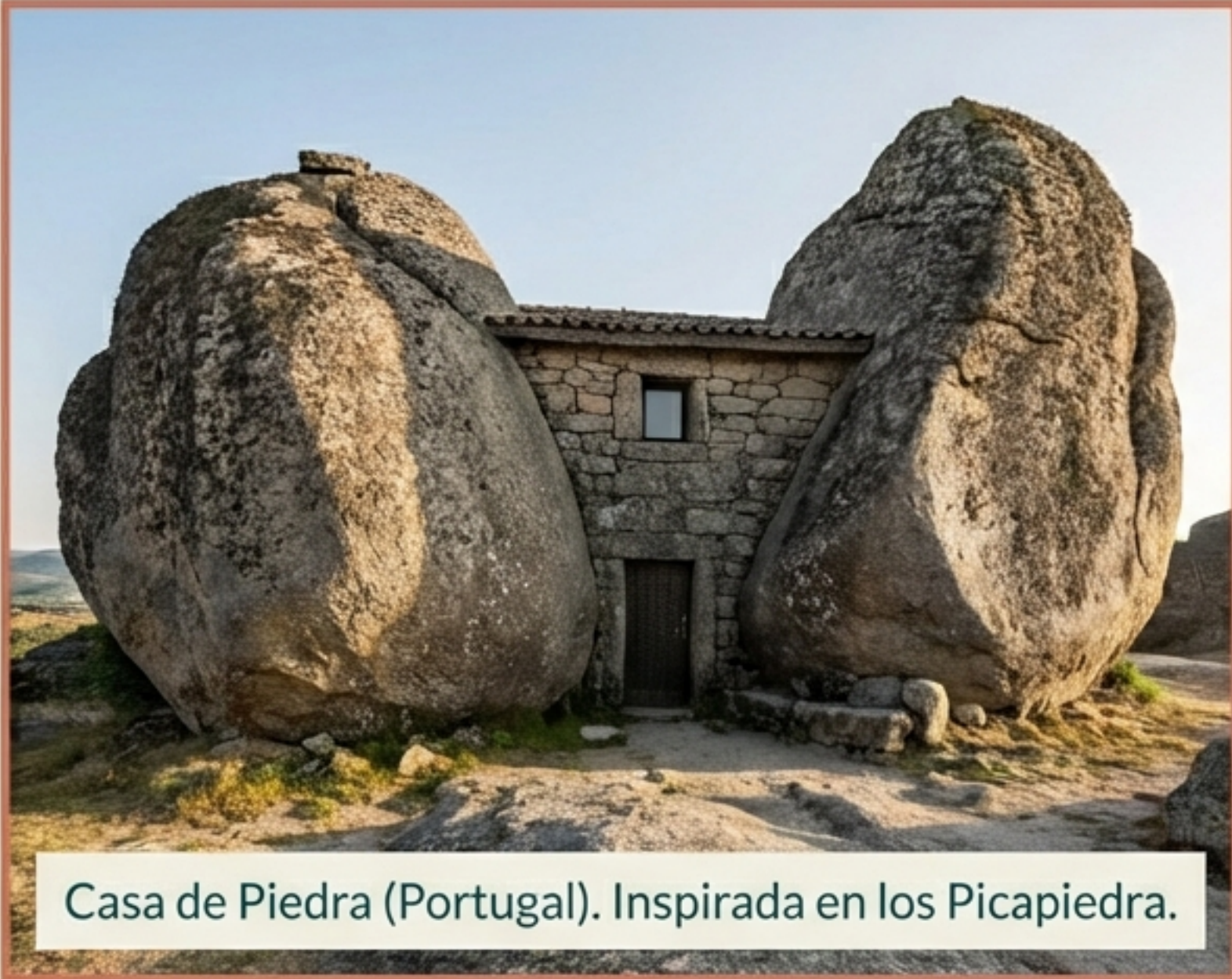
Casa de Piedra (Portugal). Inspirada en los Picapiedra.