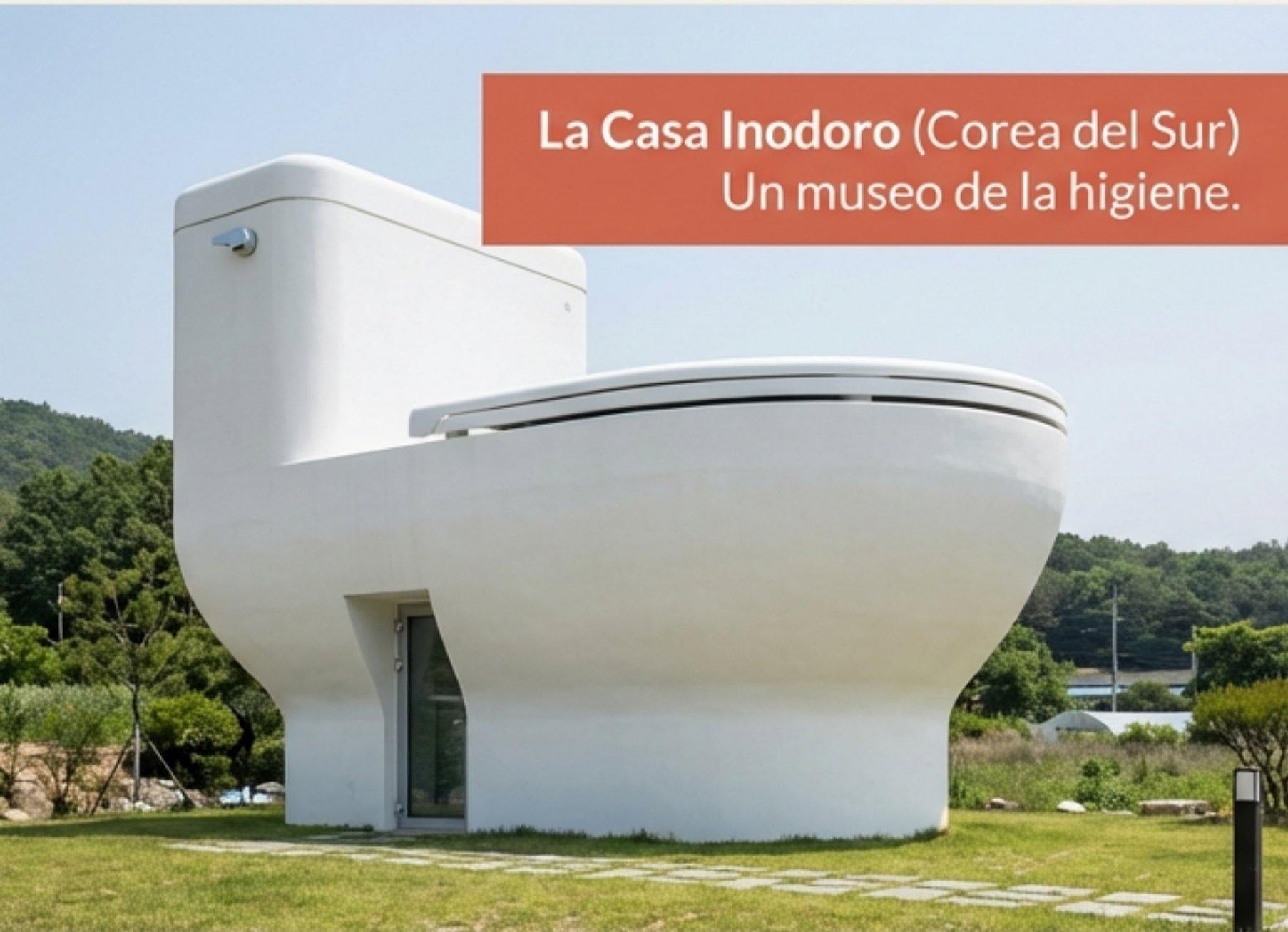
La Casa Inodoro (Corea del Sur) Un museo de la higiene.