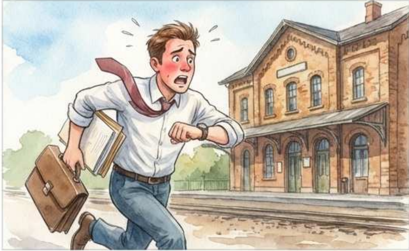
Acuarela 1: Voy para la estación.