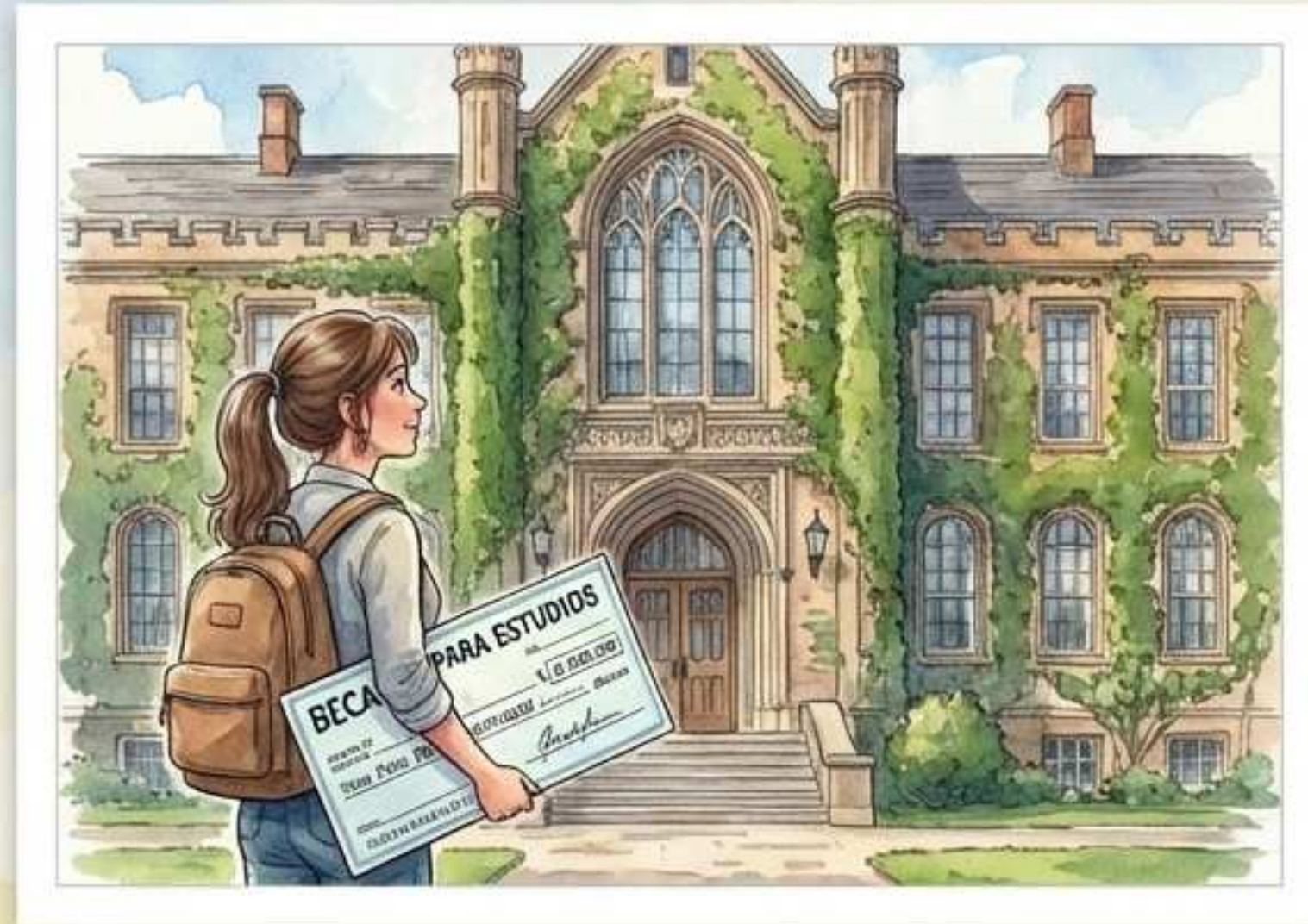
Imagen Y: A mi hija le han dado una beca por sus estudios.

Imagen X: A mi hija le han dado una beca para sus estudios.